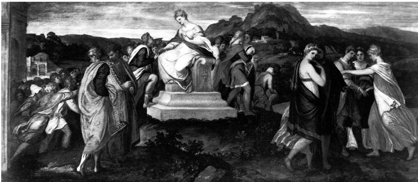
Lambert Sustris, Giardino d'amore , Firenze, Fondazione Roberto Longhi.